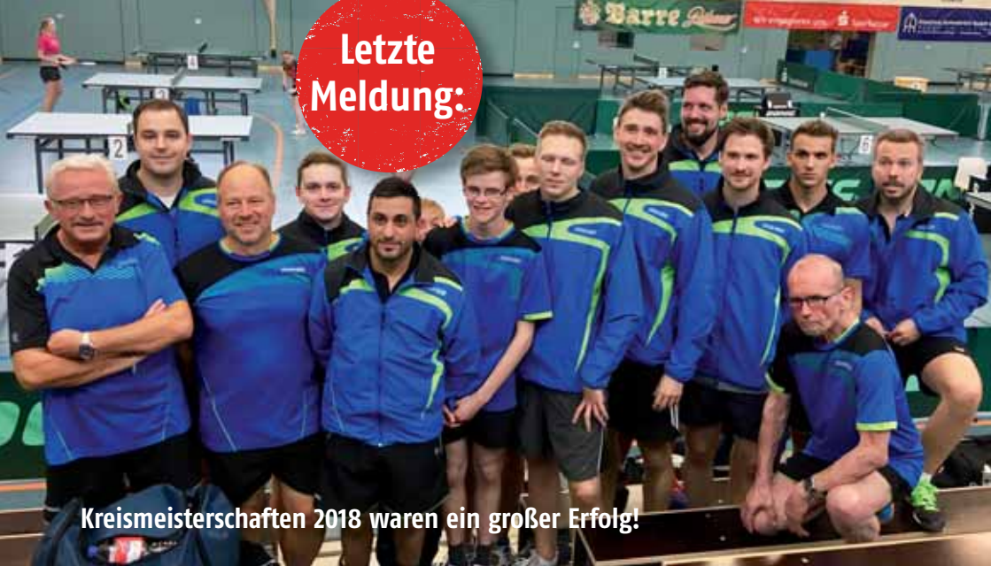
Kreismeisterschaften 2018 waren ein großer Erfolg!